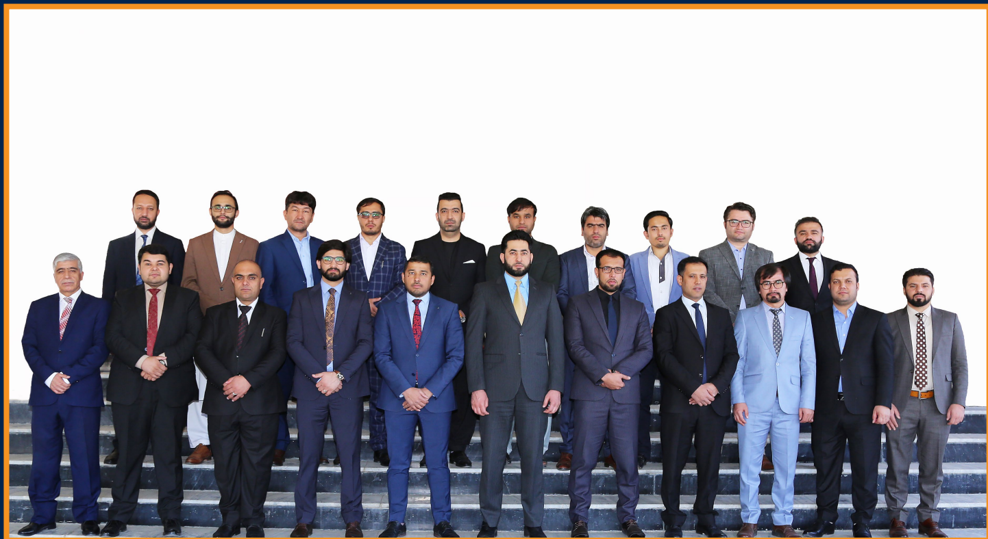
هيئت رهبري اداره عالي تفتيش